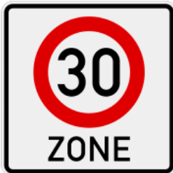
Zeichen 274.1 (Beginn einer Tempo 30-Zone)

Gemäß StVO § 45 Abs. 1c werden Tempo 30-Zonen von den Straßenverkehrsbehörden im Einvernehmen mit der Gemeinde innerhalb geschlossener Ortschaften angeordnet, insbesondere in Wohngebieten und Gebieten mit hoher Fußgänger- und Fahrradverkehrsdichte. Die Anordnung darf sich nicht auf weitere Vorfahrtstraßen (Zeichen 306) erstrecken. An Kreuzungen und Einmündungen innerhalb der Zone muss grundsätzlich "links vor rechts" gelten.